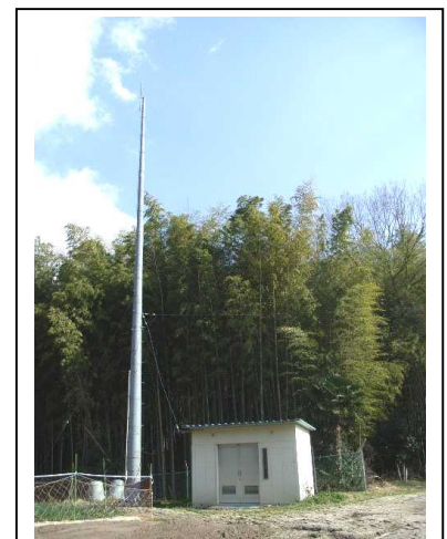
農業センターの観測局