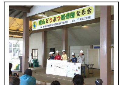
どうぶつ探偵団 発表会

環境保全ソング 「ZOO っといっしょ 木っといっしょ 東山」 詞・作曲・編曲 A.M