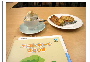
東邦ガスのエコレポートと エコ・クッキングの作品

こういう活動をしていること自体、市民に知られていないので、毎月の検針票で広報したらどうか、材料の購入から関わり、地産地消で、という意見。学校の家庭科室を使う出前料理教室はどうかなど、いろいろな意見がでて、東邦ガス環境部の方は、参考にしたいといっていました。