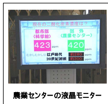
農業センターの液晶モニター