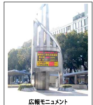
広報モニュメント