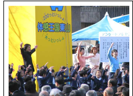
オープニングセレモニー