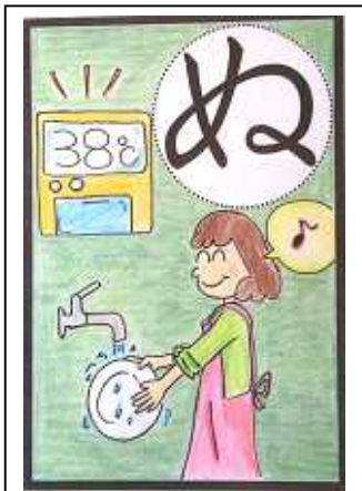
ぬるめのおゆで エネルギーを せつやくしよう