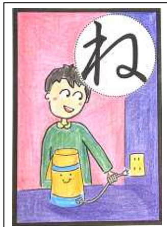
ねるときや おでかけするときは でんき ポットの ほおんはやめて