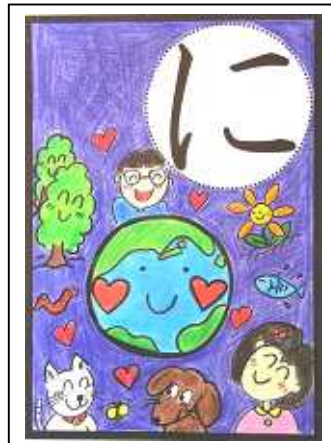
にんげんと いきものみんなで わをつくらう