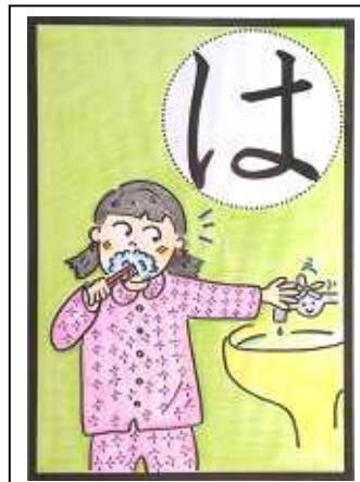
はみがきするとき おみずは とめよう