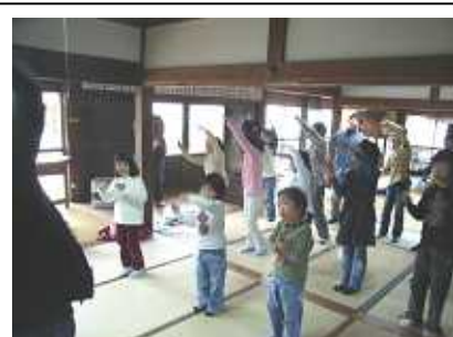
みんなでへらそうCO2