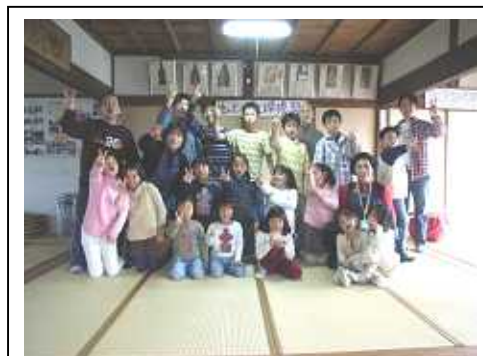
みんなで記念撮影