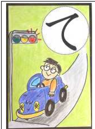
ていしゃちゅう アイドリング ストップしよう