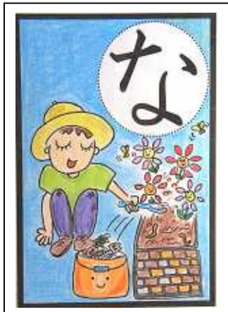
なまごみも つちにまぜれば おはなのえいよう