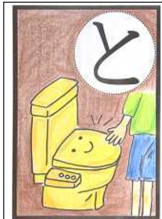
トイレをつかわないときは だんぼうべんざの ふたしめよう!